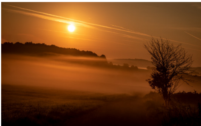
5. Platz: Anette MAYER