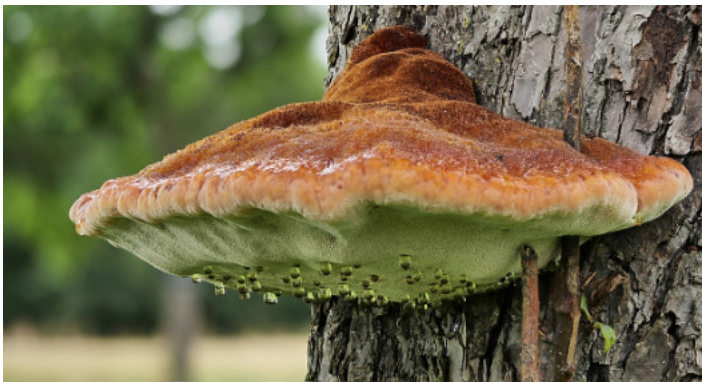
4. Platz: Karl-Heinz FISCHER