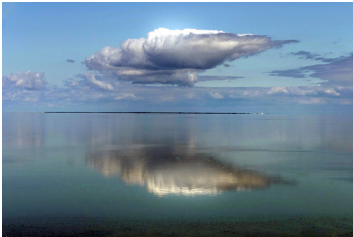
5. Platz: Renate KLINKEL