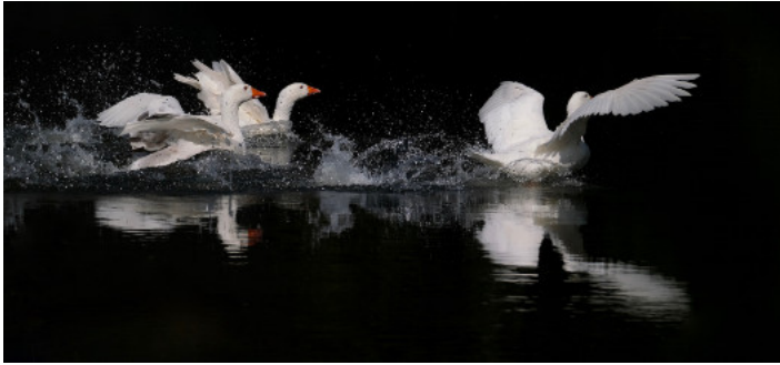
2. Platz: Arno THILO