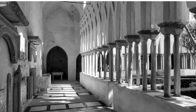
5. Platz: Winfried WYNOHRADNYK >