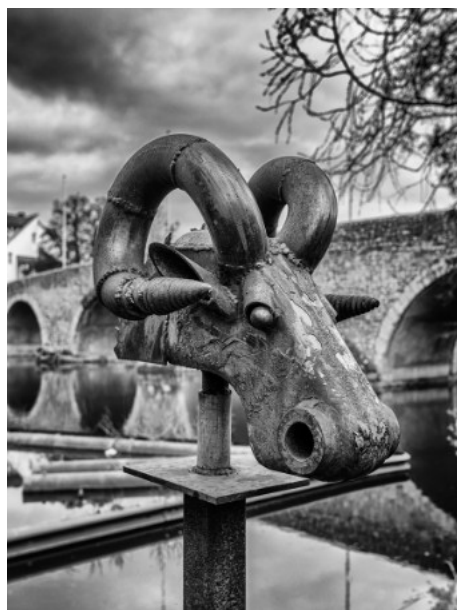
4. Platz: Manfred JUNG