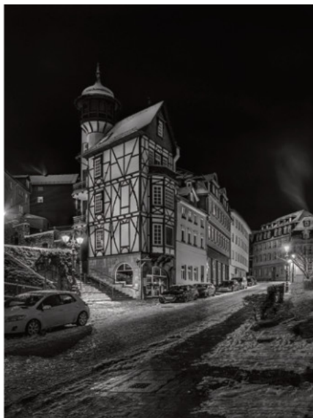
2. Platz: Lamar DREUTH