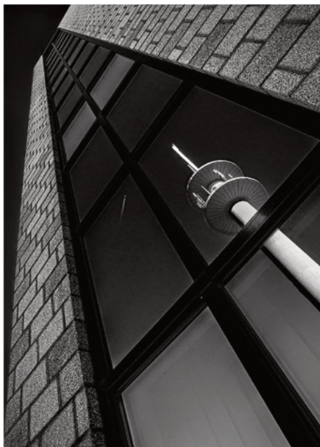
3. Platz: Lamar DREUTH