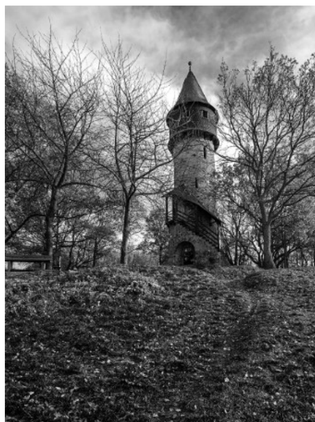
4. Platz: Norbert BLAHA