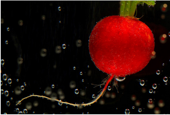
2. Platz: Renate KLINKEL