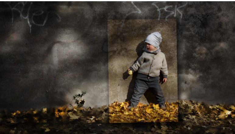
2. Platz: Walter SCHWAB