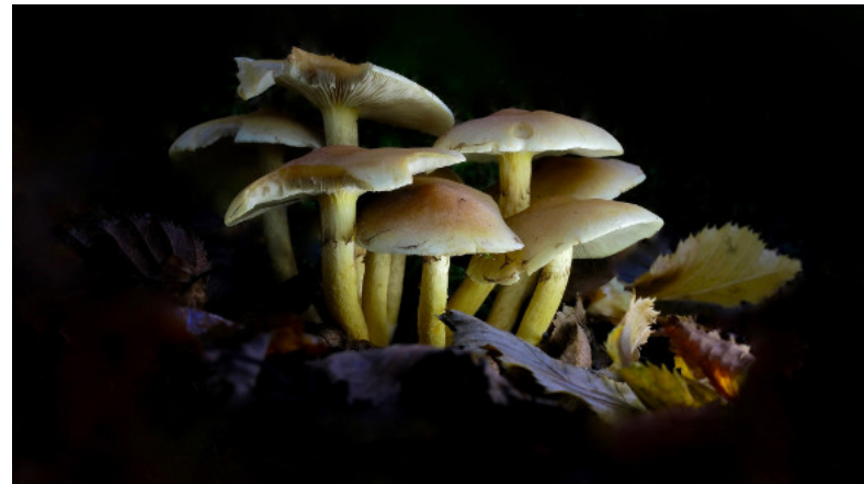
3. Platz: Arno THILO