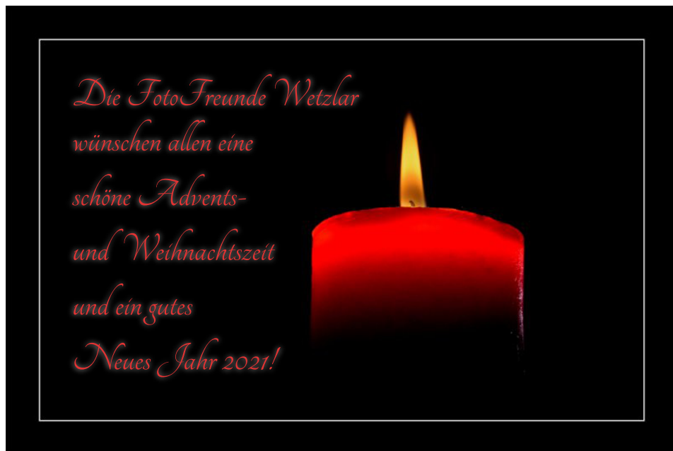
Bild des Monats November