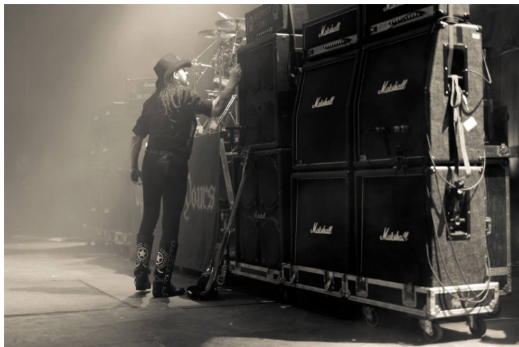
Motörhead