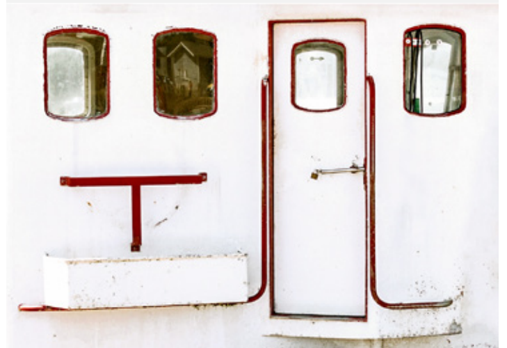
Platz 4: Michel SCHWARZER