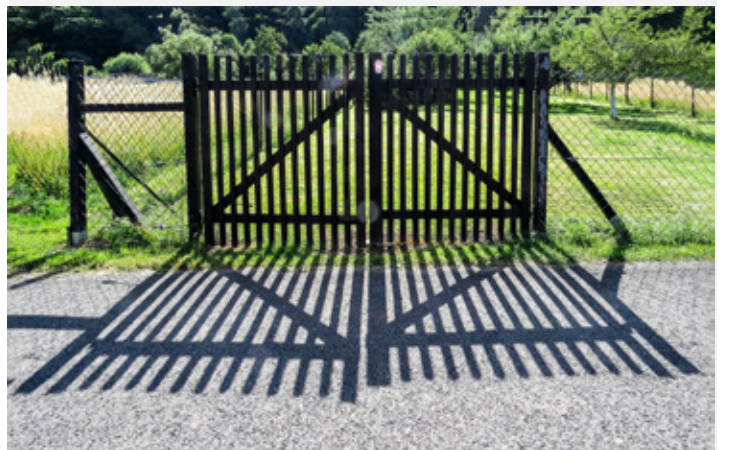
Platz 5: Norbert BLAHA