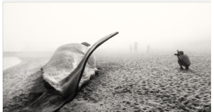
Platz 5: Walter SCHWAB