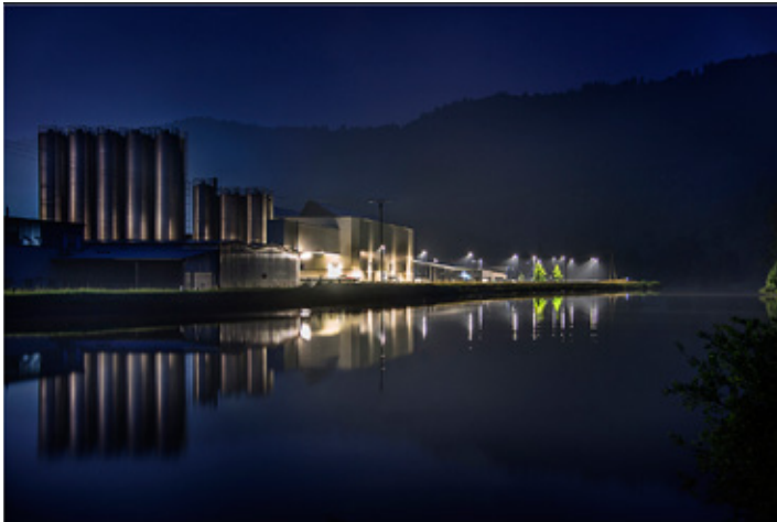
Platz 1: Lamar DREUTH