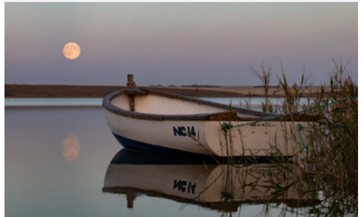
Platz 2: Michel SCHWARZER

Import, Export, Druck oder das eigentliche Thema Entwicklung - Sigi hatte für jede Frage eine gute und nachvollziehbare Antwort. Der Intensivkurs am Sonntag ging von 10 bis 17:30 Uhr. Jeder Teilnehmer profitierte davon und nahm neue Infos und Motivation mit.