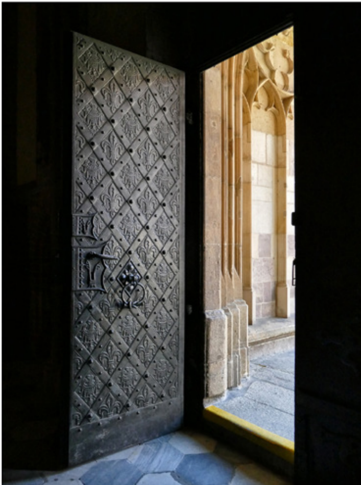
Platz 2: Harald HARTMANN