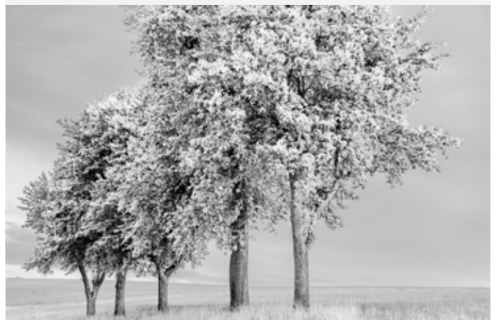
Platz 4 und 5: Claudia SCHMIDT