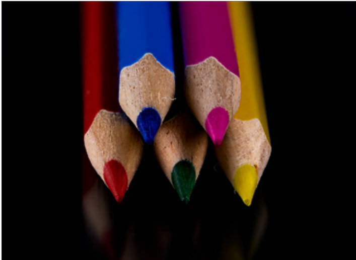
Platz 2 und 3: Michel SCHWARZER