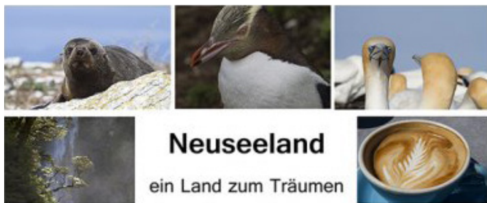
Neuseeland ein Land zum Träumen

Jeder ist eingeladen, die Rundreise in einer Multivisions-Show mitzuerleben: Am 9. März 2018 um 19:00 Uhr in der Wetzlarer Kulturstation. Bitte vorher dort anmelden!