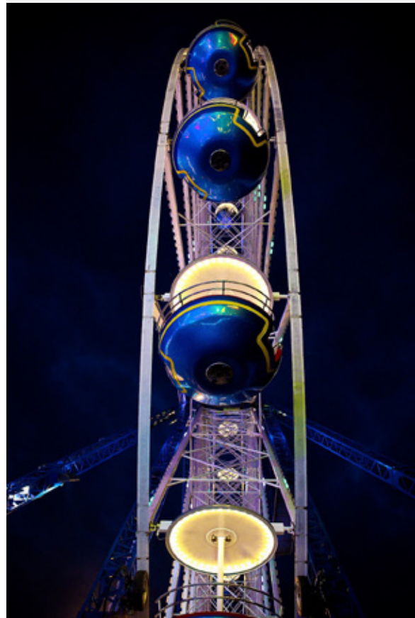
Platz 4: Sven LAMERS