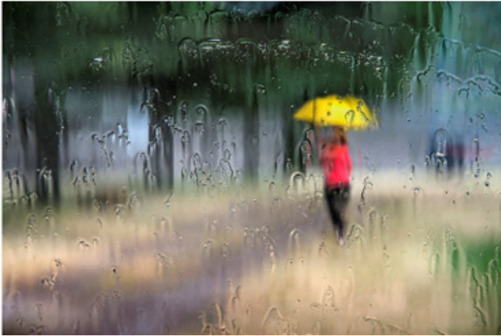
Platz 2: Lamar DREUTH