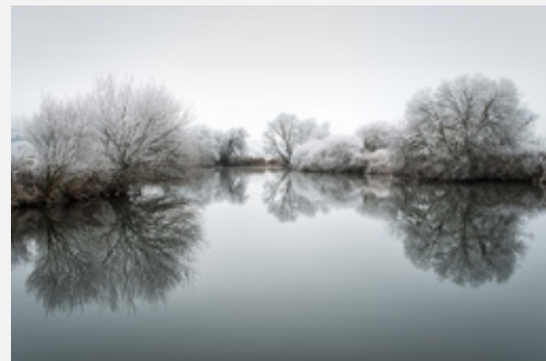
Platz 3: Lamar DREUTH