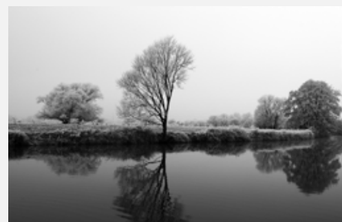
Platz 5: Thomas NEEB