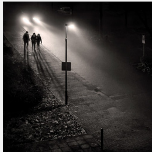
Platz 2: Lamar DREUTH