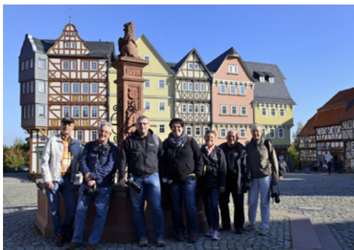
Foto-Ausflug in den Hessenpark

Daß der Hessenpark in Neu-Anspach auch unter fotografischen Aspekten immer einen Besuch wert ist, davon überzeugte sich eine Gruppe von FotoFreunden Anfang Oktober.