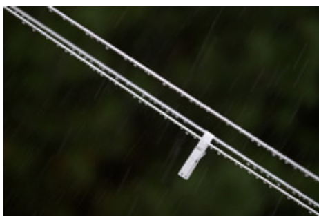
PLATZ 2: WALTER SCHWAB (LINKS), PLATZ 3: WALTER SCHWAB (OBEN MITTE), PLATZ 4: KARIN HEBISCH-HOYER (UNTEN MITTE), PLATZ 5: WALTER SCHWAB (RECHTS)

Einsendeschluß für das BdM Oktober ist der 13. Oktober (freies Thema). Bitte max. 3 Bilder (max. 1920 px × 1080 px) pro Person an bdm@fotofreunde-wetzlar.de .