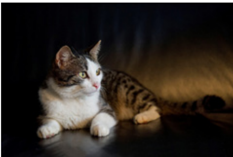
PLATZ 2: MARKUS JAKOB (OBEN LINKS), PLATZ 3: WALTER SCHWAB (OBEN RECHTS), PLATZ 4: MOHAMMED OSMAN (2. REIHE LINKS), PLATZ 5 TEILEN SICH: MARKUS JAKOB (MITTE RECHTS), BURKHARD KLEIN (3. REIHE LINKS), UND BERND DECK (UNTEN RECHTS, UNTEN LINKS).