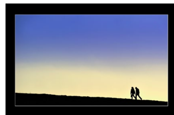
Platz 1 und 4: Bernd DECK (links, rechts unten), Platz 2 und 3: Lamar DREUTH (oben, rechts oben). Platz 5: Burkhard KLEIN (unten).