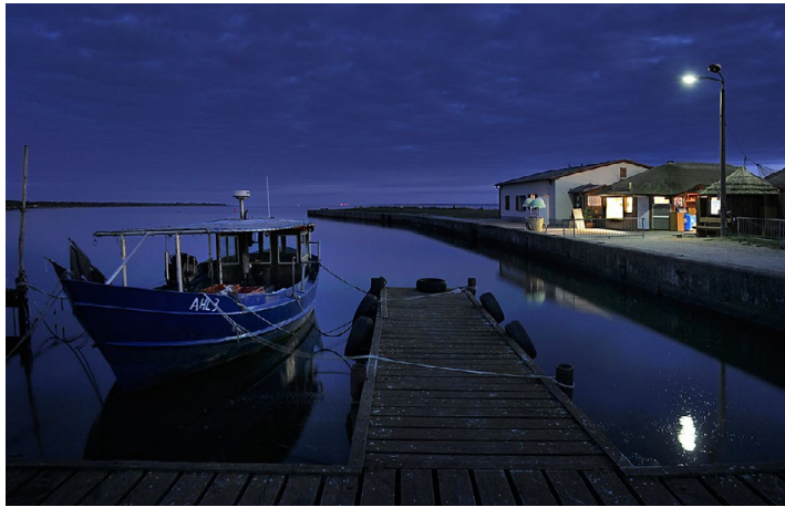
Platz 1: Lamar DREUTH (90 Punkte) – Herzlichen Glückwunsch!

Abendstimmung in einem kleinen Hafen, ausdrucksstark und gefühlvoll aufgenommen von Lamar DREUTH – das ist das Siegerbild unserer »Bild des Monats«-Konkurrenz November. Die Bilder der ersten fünf Plätze gibt es immer in unserer Galerie unter www.fotofreunde-wetzlar.de zu sehen.