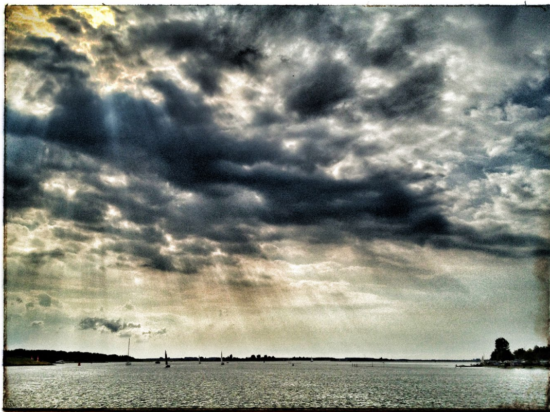
Wolken über dem Veerse Meer, Zeeland (iPhone 4S + Snapseed)

Ich hoffe, meine Vereinskameradin- nen und -kameraden waren nicht ganz so »faul« wie ich und haben in ihren Urlauben fleißig auf die Aus- löser gedrückt. Auf die bestimmt tollen Ergebnisse freuen wir uns am Dienstag, 1. Oktober, ab 20.00 Uhr.