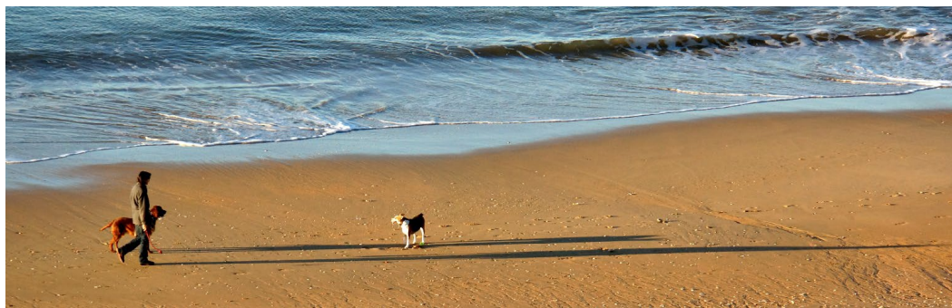
2 x Platz 3 (95 Punkte): Die Bilder von Dieter DAUSER (oben) und Joachim FREWERT (rechts)