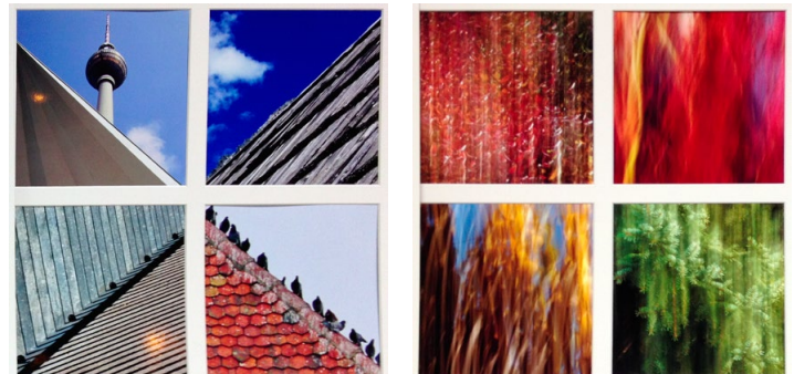
Platz 2 (118 Punkte): »Dachkomposition« von D. DAUSER