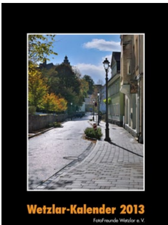
Wetzlar-Kalender 2013 FotoFreunde Wetzlar e. V.

Es geht auf Weihnachten zu, und die noch erhältlichen Exemplare werden langsam knapp! Inkl. 6 Ansichtskarten zum Ausschneiden. Preis: 16,80 €