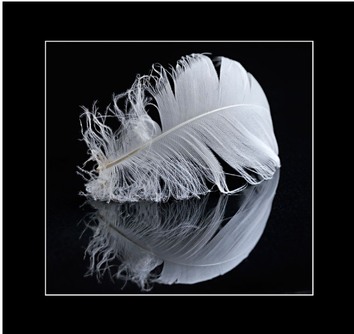
Platz 1: Lamar DREUTH (79 Punkte)