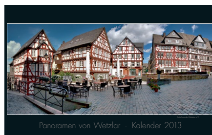
Panoramen von Wetzlar · Kalender 2013

»Oskar Barnack – Erfinder der Leica« Stadtmuseum Wetzlar, ab 25. Mai 2012