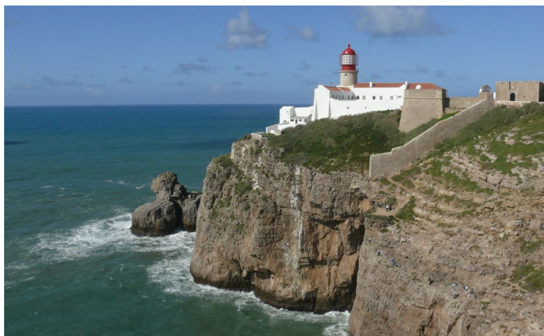
Dieter Dausers Algarve-Bilder sind noch bis Ende Juli 2012 in den Räumen des Ärztlichen Notdienstes (Forsthausstr. 3, Wetzlar) zu den regulären Öffnungszeiten zu sehen