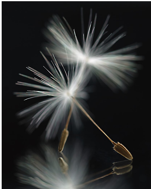
20 von 20 mögl. Punkten: Löwenzahn-Samen von Lamar DREUTH

Colchester gewinnt den Gesamtwettbewerb mit 470,5 zu 455,5 Punkten. Herzliche Glückwünsche aus Wetzlar!