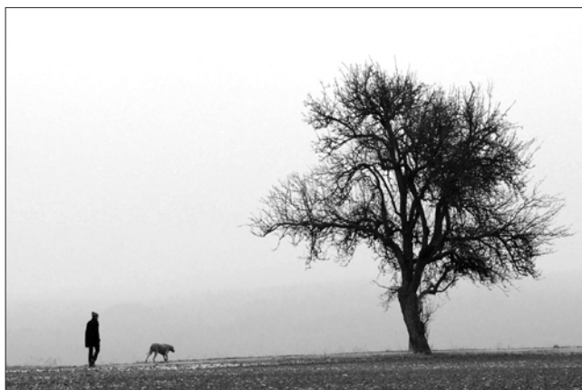
▲ Platz 2: Gerhard PFEIFER (80 Punkte)

Einsendeschluß für das Bild des Monats März ist der 13. März . Das Thema lautet diesmal Food-Fotografie (max. 3 Bilder/Pers.). Einreichungen bitte an bdm@fotofreunde-wetzlar.de