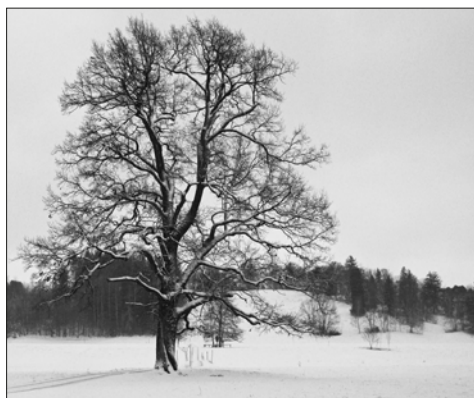
◀ Platz 3: Manfred LOH (71 Punkte)