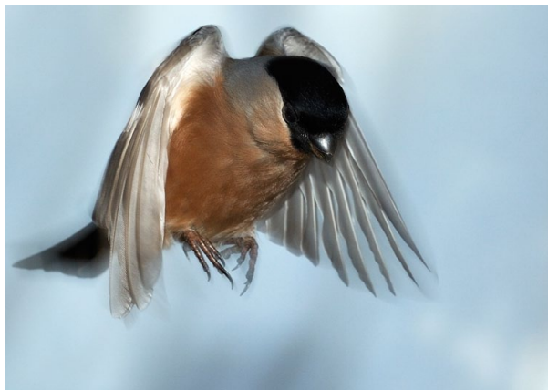
Platz 5: Wolf-Ekkehard KESSLER (81 Punkte)